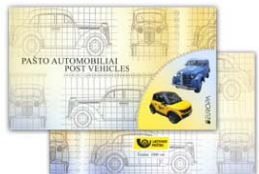
Suvenyrinio lapo – II aplankas

643 2,45 Lt x 3 – Automobilis Tazzari ZERO. 644 2,45 Lt x 3 – Automobilis Moskvitch 401.